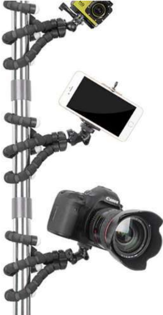
Octopus tripod / Gorilla tripod