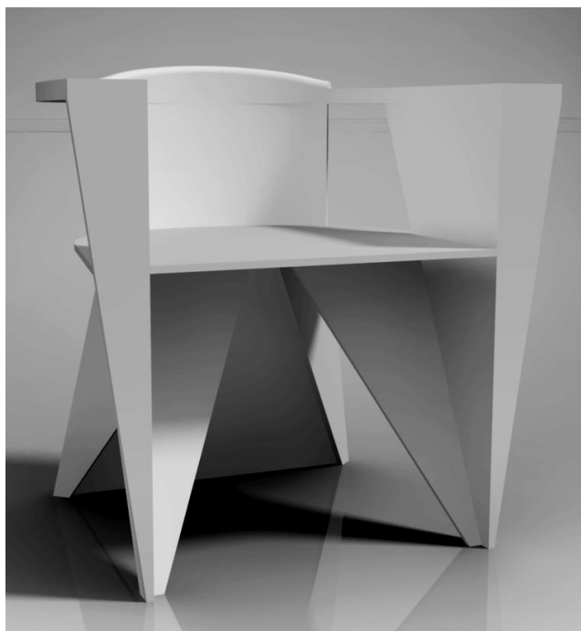
konkursa nominācijai Mēbeļu galdnieks

materiāls: bērza masīvkoksne ar tīro biezumapstrādi un virsmēriem frēzēšanai, process – jebkuri mobilie kokapstrādes instrumenti (bez stacionārām darbmašīnām), rokas elektroinstrumenti, rokas nemehanizētie instrumenti, ēvelsols; lekāli frēzēšanas šablonu izgatavošanai, aizzīmēšanai un kontrolei;