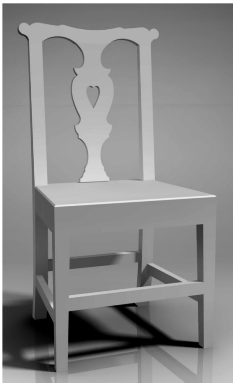
konkursa nominācijai Būvizstrādājumu galdnieks

materiāls: cieto lapu koku masīvkoksne zāģētās sagatavēs ar ~3mm virsmēru uz katru pusi, process – nemehanizētie rokas instrumenti un āra ēvelsols ; šabloni formu aizzīmēšanai un kontrolei;