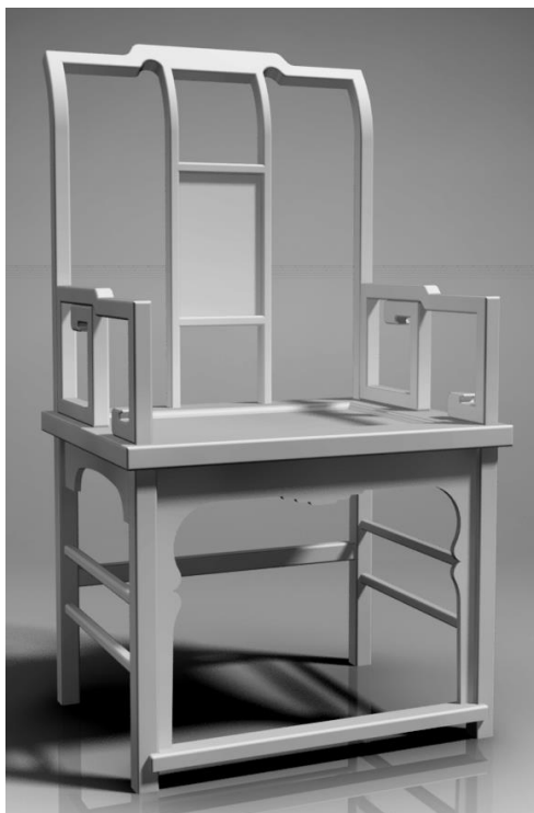
konkursa nominācijai Mobilā darbnīca

materiāls: bērza masīvkoksne ar tīro biezumapstrādi un virsmēriem frēzēšanai, process – jebkuri mobilie kokapstrādes instrumenti (bez stacionārām darbmašīnām), rokas elektroinstrumenti, rokas nemehanizētie instrumenti, ēvelsols; lekāli frēzēšanas šablonu izgatavošanai, aizzīmēšanai un kontrolei;