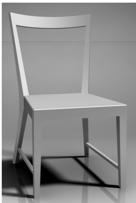
konkursa nominācijai Galdnieks

materiāls: cieto lapu koku masīvkoksne zāģētās sagatavēs ar ~3mm virsmēru uz katru pusi, process – nemehanizētie rokas instrumenti un āra ēvelsols ; šabloni formu aizzīmēšanai un kontrolei;