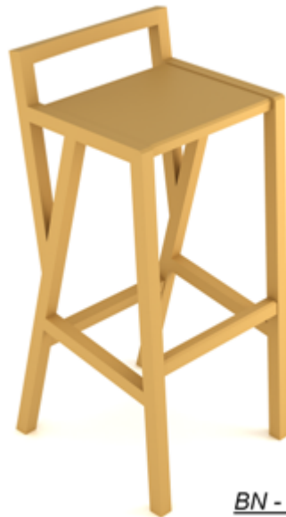
BN - 2026