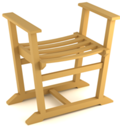
G - 2026