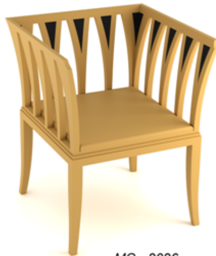
MG - 2026