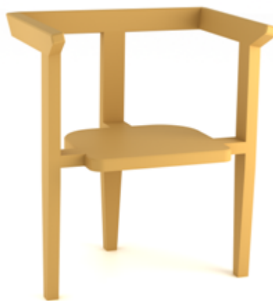
BG - 2026

konkursa nominācijai Būvizstrādājumu galdnieks